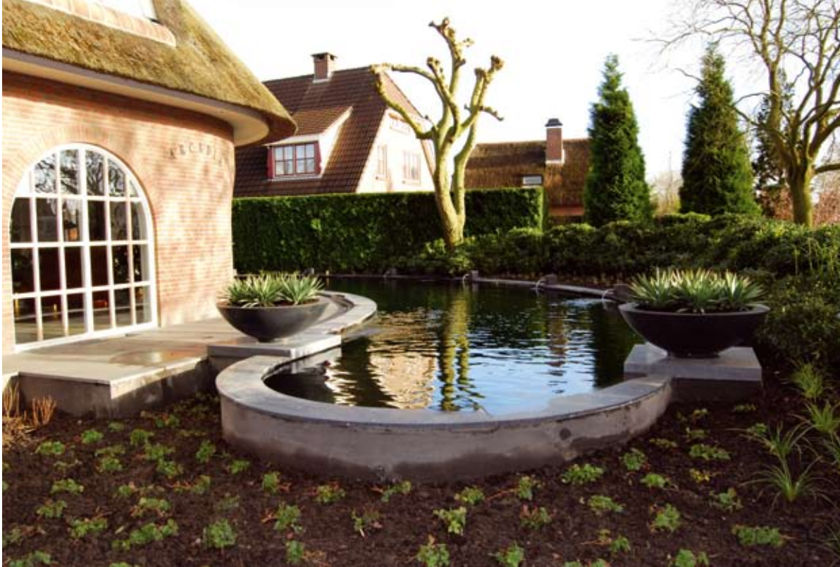
LINKS: De gracht der groten in volle glorie. Niet alleen het terras, maar ook de vijverrand is in hardsteen uitgevoerd. Wat de aankleding van de tuin betreft, is voor grote plantengroepen gekozen. Bodembedekkers, siergrassen en rhododendrons zetten er de toon. De coniferenheg op de achtergrond fungeert als groen geraamte.